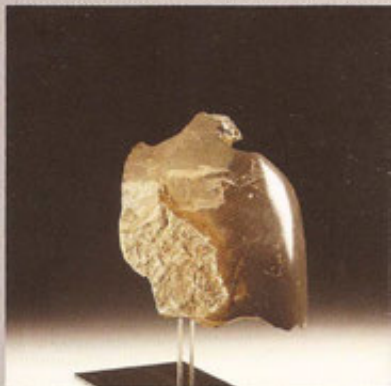
Mem martins e aço - 34x23x30 cm